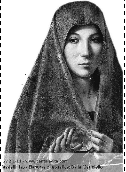
Gv 2,1-11 - www.cantalavita.com fassielli, fsp - Elaborazione grafica: Dalia Mariniello

La fede è dire “sì, ci sto... ci metto la mia parte di acqua sapendo che con Gesù può diventare vino buono”. Da Lui può venire il vero miracolo per l'umanità, ed è il Vangelo di Cristo. Seguiamo quindi il consiglio di Maria: «Qualsiasi cosa vi dica, fatela!».